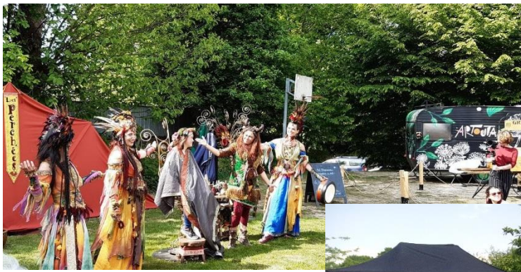
Le marché de printemps avec la participation de BVBR