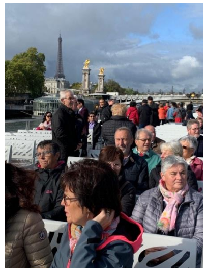
Les Lanriganais à Paris ! Visite de l'Assemblée Nationale et sortie en bateaux-mouches