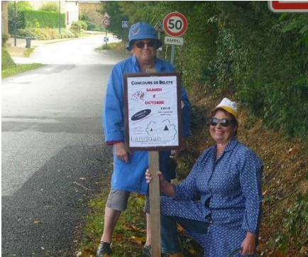
1 er Concours de belote organisé par les Z'amuzous