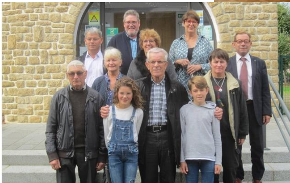
Rassemblement des Classes 9