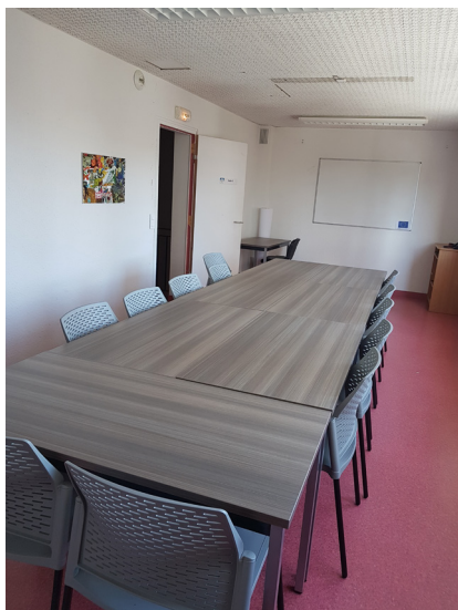
Une salle de réunion équipée en tables et chaises

L'Accès Public à Internet a été privilégié avec l'installation de tablettes de confidentialité.